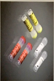
محلول کربن طول عمر 4 هفته بعد از اولین باز کردن