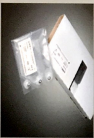
فلوپدیک عمر 8 هفته بعد از اولین استفاده